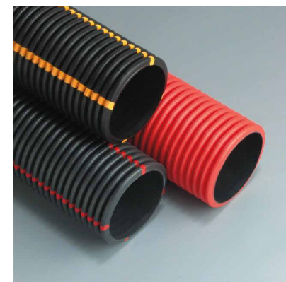
Stigmaflex cev za izvedbo freonske povezave

Mere na objektu in izvedbo priključkov je dolžan preveriti posamezen izvajalec na objektu pred začetkom del. V primeru sprememb tehnološke opreme in gradbeno obrtniških del vezanih na tehnološko opremo kuhinje, ki so posledica sprememb in zahtev s strani investitorja ali izvajalca je potrebno takoj pridobiti soglasje projektanta in investitorja.